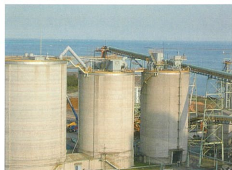
石炭灰受入サイロ

火力発電所から排出される石炭灰を、セメントキルンにて高温焼成する事で、原料代替として有効利用しています。