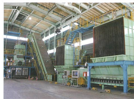
廃プラスチック処理設備

廃プラ、ASR (自動車破碎残さ)、RPF などを石炭等代替として有効利用しています。破碎機、塩素バイパス設備、前処理設備の活用により安定処理を行っています。