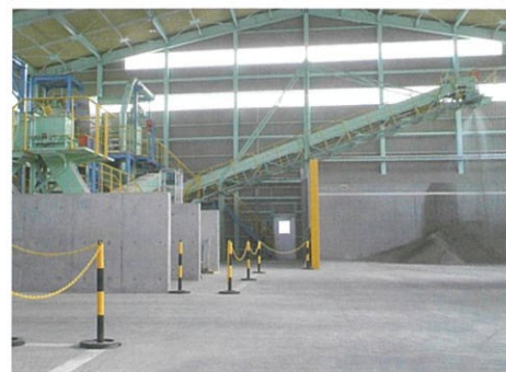
焼却灰前処理設備

都市ごみ焼却灰を異物除去・金属回収した後、水洗浄によって脱塩処理を施し、原料代替としてリサイクルしています。